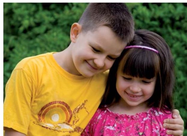
Observer pour mieux répondre aux cas individuels